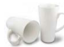
CM01-WSUBMUG17 Taza cónica de cerámica 17 Oz.