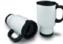
CM05-WSSCARCUP Jarra viajera blanca de acero de 16 Oz. con tapa.