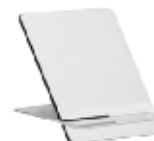
CM26-SUBMDFPFR2025 Portarretrato de MDF. Tamaño: 20x25 cm.