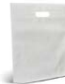
CM17-BNWPBAG Bolsa non woven de 35x37 cm.