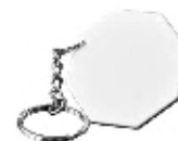
CM26-SUBMDFHXKEY04 Llaveros Sublimables de MDF. Tamaño: 4x 4 cm./ 20g.