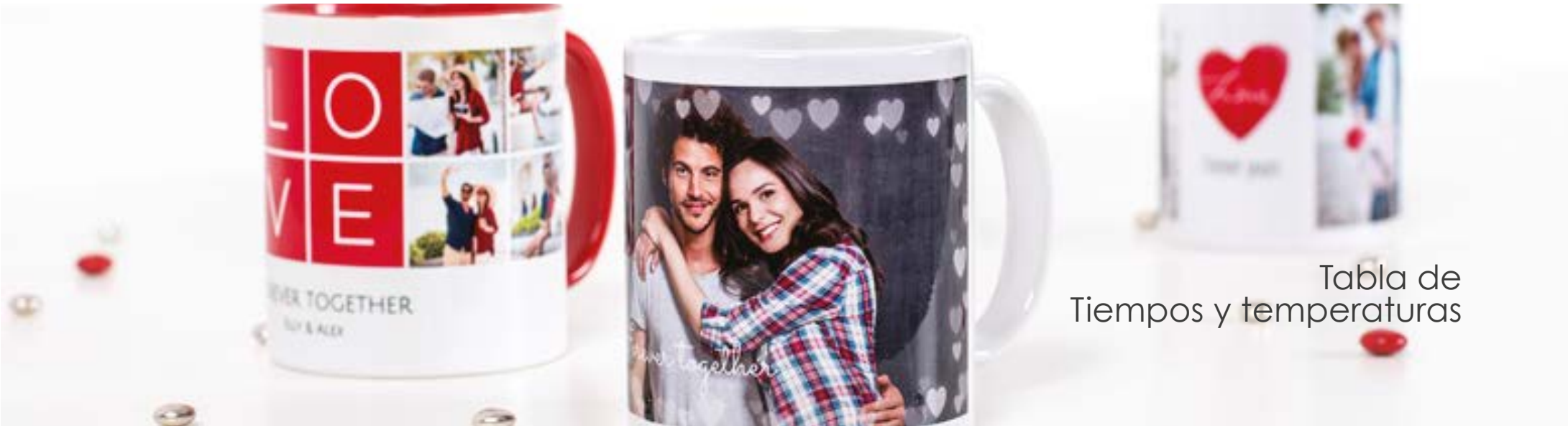
Tabla de Tiempos y temperaturas