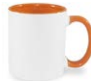
CM01-IAORMUG11 Taza de color naranja interno y asa 11 Oz.