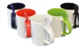
CM01-SPCONSUBMUG11 Taza con cuchara 11 Oz.