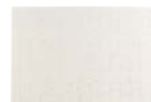
CM09-A3/A4/A5PAPJIG Rompecabezas tradicional de cartón sublimable. Tamaños: A3 / A4 y A5