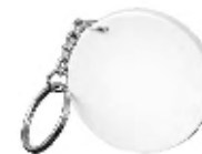
CM26-SUBMDFRDKEY05 Llaveros Sublimables de MDF Tamaño: 5x 5cm.