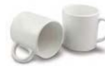
CM01-WSUBMUG6 Taza de cerámica 6 Oz.