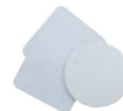
CM08-RNDCOSTR Posa vasos redondo y cuadrado de neopreno.