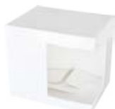
CM09-CDBDMG11 Caja de cartón sublimable para tazas 11 Oz.