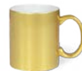
CM01-G/SSUBMUG11 Taza de cerámica dorada o plateada 11 Oz.