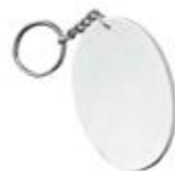
CM26-SUBMDFOVKEY06 Llaveros Sublimables de MDF. Tamaño: 6.8x 4.8 cm./ 20g.