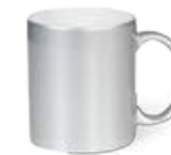
CM01-SSUBMUG11 Taza de cerámica dorada o plateada 11 Oz.