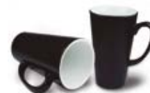
CM18-HASUBMUG17 Taza de cerámica de color cambiante con calor 17 Oz.