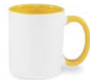
CM01-IAYEMUG11 Taza de color amarillo interno y asa 11 Oz.