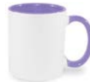
CM01-IAPUMUG11 Taza de color purpura interno y asa 11 Oz.