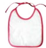
CM07-VCBABIB Babero rosado para bebé.