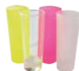
CM20-FGSUBMUG04 Vaso de vidrio 2.5 Oz.