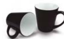
CM18-HASUBMUG12 Taza de cerámica de color cambiante con calor 12 Oz.