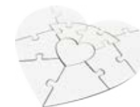
CM26-SUBMDFJIGPZLHT Rompecabezas de MDF con forma de corazón.