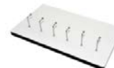
CM26-SUBMDFKYPLQ01 Posallave Sublimables de MDF.