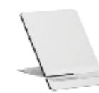
CM26-SUBMDFPFR1217 Portarretrato de MDF. Tamaño: 12x17 cm.