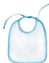
CM07-VCBABIB Babero Azul para bebé.