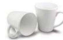
CM01-WSUBMUG12 Taza cónica de cerámica 12 Oz.