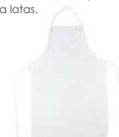
CM11-POLAPRGAA Delantal de poliéster sublimable