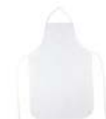
CM11-POLAPRGAB Delantal sencillo de poliéster sublimable.