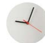
CM26-SUBMDFBRDCK30 Reloj de MDF sublimable. Tamaño: 30 cm.