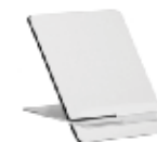
CM26-SUBMDFPFR1520 Portarretrato de MDF. Tamaño: 15x20 cm.