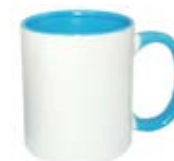
CM01-IABLUMUG11 Taza de color azul interno y asa 11 Oz.