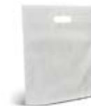
CM17-SNWPBAG Bolsa non woven de 19.5x30 cm.