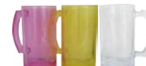
CM15-CGSUBMUG16 Jarra de vidrio claro transparente o de colores sublimable 16 Oz.