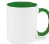
CM01-IAGRMUG11 Taza de color verde interno y asa 11 Oz.