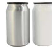
CM05-S114/ W114 Lata de aluminio con tapa de silicona 500ml.