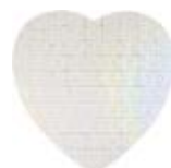
CM09-HPAPJIG Rompecabezas de cartón forma de corazón.