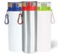
CM03-W/S146-750 750 ml. Botella deportiva blanca con tapa removible, disponible en blanca y plata.