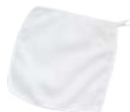
CM11-POLKITOW Toalla de poliéster para sublimar.