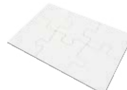
CM26-SUBMDFJIGPZL21 Rompecabezas de MDF de 6 piezas. Tamaños: 20x13 cm.