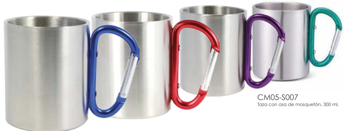
CM05-S007 Taza con asa de mosquetón. 300 ml.