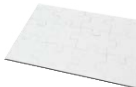
CM26-SUBMDFJIGPZLA4 Rompecabezas de MDF. Tamaño: A4