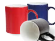
CM18-HASUBMUG11 Taza de cerámica de color cambiante con calor negro, rojo o azul 11 Oz.