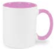
CM01-IAPIMUG11 Taza de color rosado interno y asa 11 Oz.