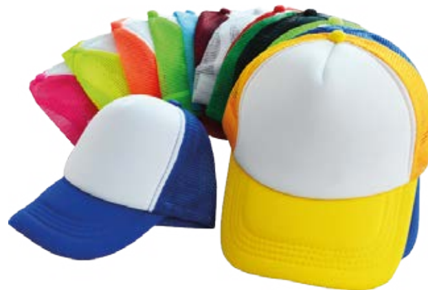
CM11-SUBMSHCAP Gorra con malla de variados colores, disponibles para niños y adultos.