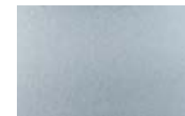
CM12-BAREC2030 Láminas cepilladas de aluminio sublimables. Tamaño: 20x30 cm.