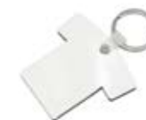
CM26-SUBMDFTSKEY05 Llaveros Sublimables. Tamaño: 5x 4.5 cm./ 20g