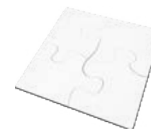
CM26-SUBMDFJIGPZL17 Rompecabezas de MDF de 4 piezas. Tamaños: 16x16 cm.