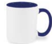
CM01-IABLMUG11 Taza de color cobalto interno y asa 11 Oz.