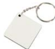
CM26-SUBMDFSQKEY04 Llaveros Sublimables de MDF. Tamaño: 4.5x 4.5cm.