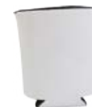
CM08-CANCL Aislante térmico de poliuretano para latas.