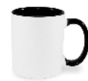
CM01-IABKMUG11 Taza de color negro interno y asa 11 Oz.