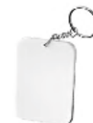
CM26-SUBMDFRCKEY06 Llaveros Sublimables de MDF. Tamaño: 6.8x 4.8 cm.