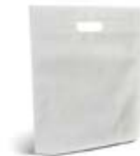
CM17-BNWPBAG Bolsa non woven de 34x43 cm.