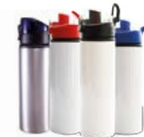
CM03-W/S143-750 750 ml. Botella deportiva con botón.