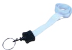
CM026-WSUBLAN Lanyard / Porta carnet