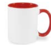
CM01-IAREMUG11 Taza de color rojo interno y asa 11 Oz.