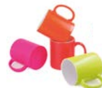
CM01-FLUSUBMUG11 Taza fluorescente para sublimar de 11 Oz.