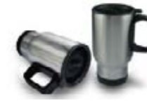
CM05-SSSCARCUP Jarra viajera plata de acero de 16 Oz. con tapa.