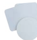
CM26-SUBMDFRNDCC09 Posa vasos redondo y cuadrado de PVC de 9x9 cm.