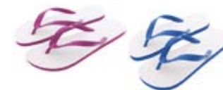
CM10-SUBSANDL Sandalias para sublimación. Tallas S / M / L para adultos y niños.