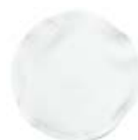
CM11-POLTORBAG Tortillero de poliéster sublimable.