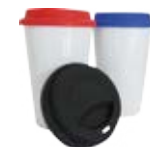
CM01-STSUBMUG12 Vaso de cerámica con tapa de silicona 12 Oz.