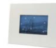
CM26-SUBMDFPFR2030 Portarretrato de MDF. Tamaño: 20x30 cm.